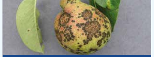
Armut Karalekesi ( Venturia pirina )

KORİTUS® sistemik bir fungusittir. Uygulamadan sonraki 2 saat içerisinde yapraklardan bitkiye çok hızlı bir şekilde nüfuz eder. Bitki içerisinde hem aşağıdan yukarıya doğru, hem de yaprakların bir yüzünden diğer yüzüne taşınır. Cyprodinil methionine sentezini engelleyerek, bitki dokularına patojenlerin misellerinin nüfuz etmesini ve bitki dokularında hastalık etmeni mantarların gelişmelerini engeller.