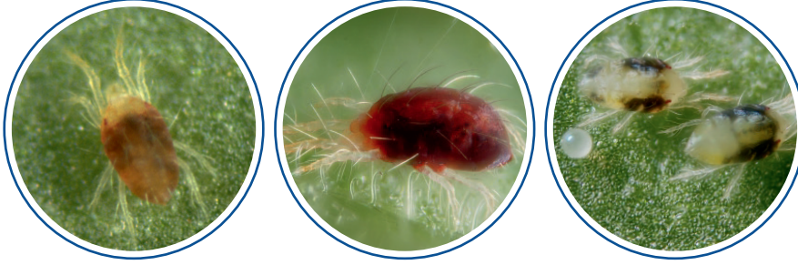
Kırmızı örümcekler ( Tetranychus cinnabarinus , Tetranychus urticae )