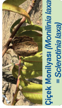
Çiçek Monilyası ( Monilinia laxa = Sclerotinia laxa )