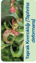
Yaprak Kıvrıklığı ( Taphrina deformans )